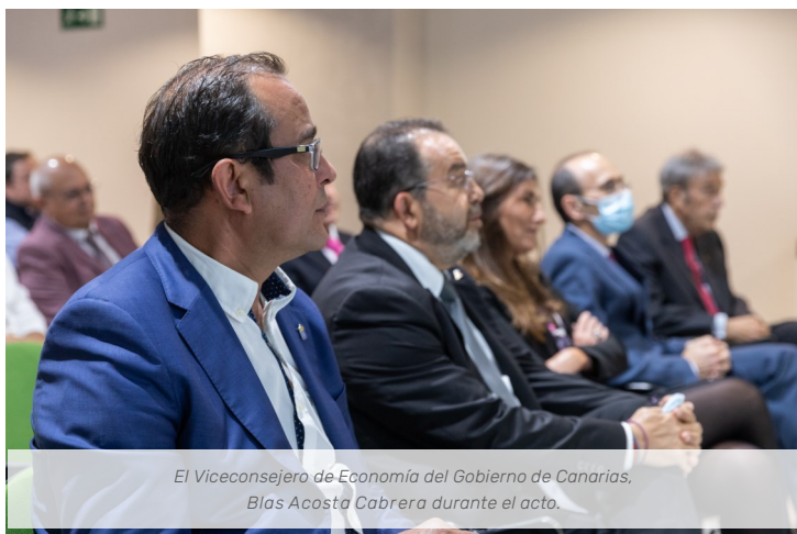
El Viceconsejero de Economía del Gobierno de Canarias, Blas Acosta Cabrera durante el acto.