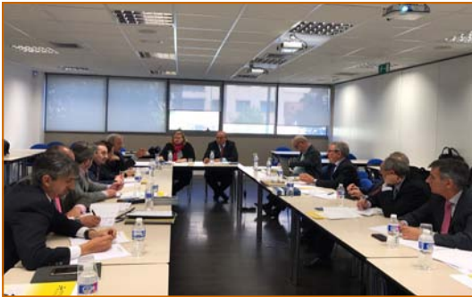
Junta Directiva de la FETTAF

El pasado 27 de abril, la Junta directiva de la FETTAF se reunió en Madrid.