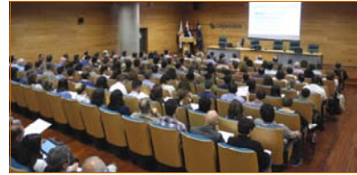
Aforo completo en el Salón de Actos de Caja Siete en S/C de Tenerife.