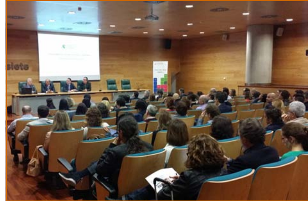
Salón de actos de Caja Siete en Santa Cruz de Tenerife

Agradecer una vez más la colaboración de LinkSoluciones, del Gobierno de Canarias, Universidad Camilo José Cela y Francis Lefebvre por el apoyo en la acciones formativas de la asociación.