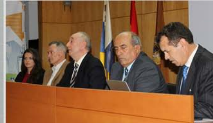
Presentación X Edición Experto en Asesoría Fiscal