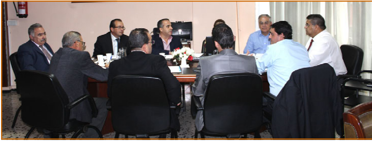
Junta de Gobierno celebrada en la sala de juntas de la sede de la Asociación el pasado día 20 de diciembre.

El pasado 20 de diciembre, en la Sede de la Asociación de Asesores Fiscales de Canarias, se procedió a la celebración de la última Junta de Gobierno del año.