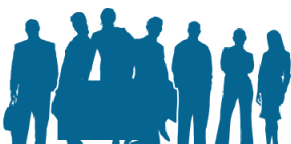
Unión de Colectivos de Profesionales Tributarios (UCPT)

Reunión de colectivos profesionales que forman la reciente Unión de Colectivos Profesionales Tributarios (UCPT)