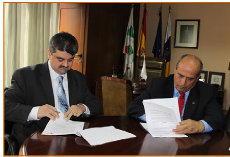
Instante de la firma del convenio