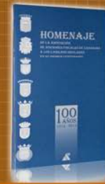
La Génesis de la Hacienda Cabildicia