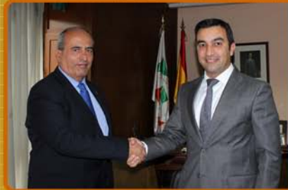
Firma Convenio entre la AAFC y Gesvalt