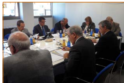
Un instante durante la reunión celebrada en Madrid

Convocatoria celebrada en la ciudad de Madrid con el siguiente Orden del Día: