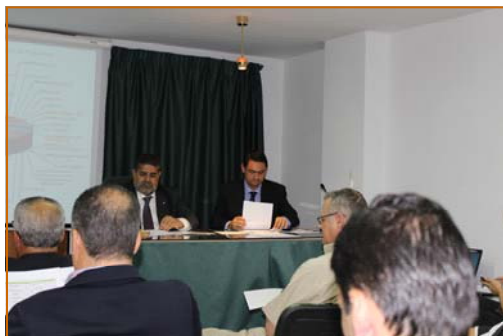
Instantes iniciales de la Asamblea celebrada en la sede de la Asociación

El pasado 31 de mayo, comenzando a las 13.00 horas, se celebró la Asamblea General Ordinaria en el Salón de Actos de la Asociación de Asesores Fiscales de Canarias, en Las Palmas de Gran Canaria.