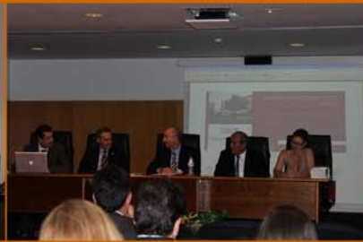
Acto Clausura VI Edición Experto en Asesoría Fiscal