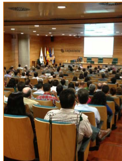
Más de 200 personas se dieron cita en el Salón de Actos de CajaSiete en Santa Cruz de Tenerife.