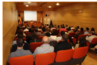
Salón de Actos de la Cámara de Comercio de Gran Canaria