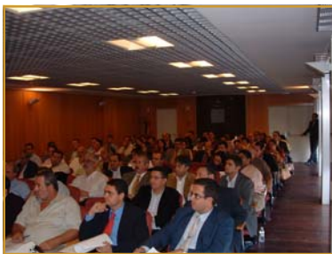
Vista del Salón de actos completamente abarrotado

De espectacular se puede catalogar la jornada que sobre el "La Jurisprudencia de la R.I.C. 2005/2006. Aspectos a tener en cuenta", organizó la Asociación de Asesores Fiscales de Canarias el pasado 17 de noviembre, con la colaboración de A3 Software y en las excelentes instalaciones de la Mutua de Accidentes de Canarias, quien dada la altísima inscripción habida, cedió desinteresadamente su salón de actos para la celebración de este acto, en lugar del salón de actos de la propia Asociación como es habitual.