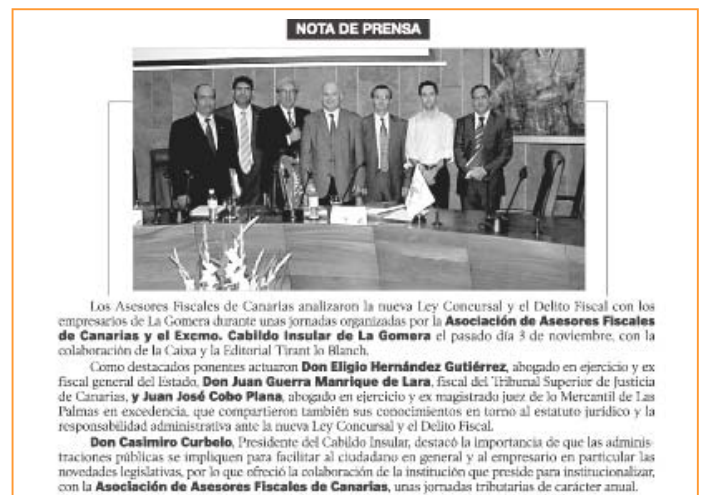
Los Asesores Fiscales de Canarias analizaron la nueva Ley Concursal y el Delito Fiscal con los empresarios de La Gomera durante unas jornadas organizadas por la Asociación de Asesores Fiscales de Canarias y el Excmo. Cabildo Insular de La Gomera el pasado día 3 de noviembre, con la colaboración de la Caixa y la Editorial Tirant lo Blanch.

general y al empresario en particular las novedades legislativas, por lo que ofreció la colaboración de la institución que preside para institucionalizar, con la Asociación de Asesores Fiscales de Canarias, unas jornadas tributarias de carácter anual.