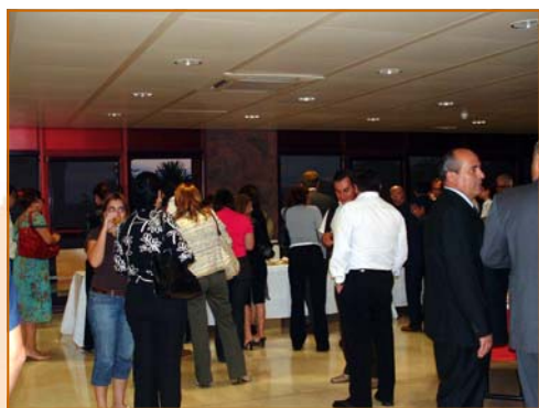
El Cabildo Insular ofreció a todos los asistentes un Coffee Break durante la pausa de las conferencias.