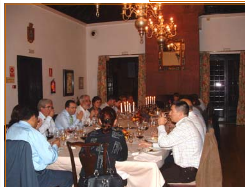
Momentos de la Cena celebrada en el Parador de Turismo de La Gomera