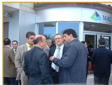
El Presidente de la Asociación con el ponente y algunos asociados, en un momento del coffee break

da a la construcción de un hotel, que no estaba terminado en 2000.