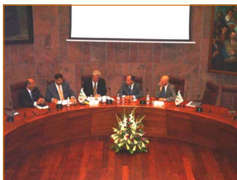
Vista de la Mesa Presidencial

la conferencia "Nombramiento de los Administradores Concursales. Estatuto Jurídico y Cuestiones más relevantes para los Administradores Concursales en la Práctica Profesional" y ponerse a disposición de la Asociación para retomar la organización de la conferencia más adelante. Desde aquí le deseamos una pronta recuperación de su lesión.