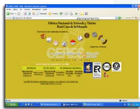
http://www.cert.fnmt.es/Certificado de Usuario