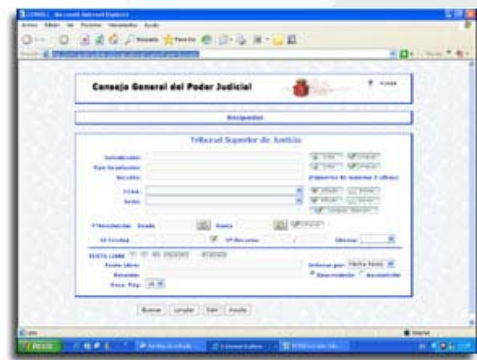
http://www.poderjudicial.es/jurisprudencia/buscador de sentencias