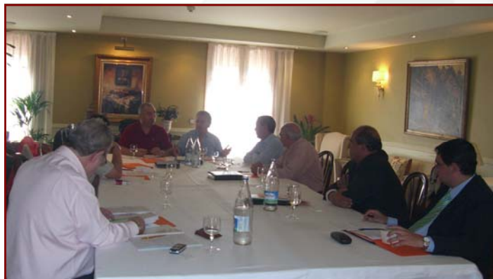
Momento de la Asamblea General

Dicho acto se hizo coincidir con una jornada tributaria organizada por la Asociación Española de Asesores