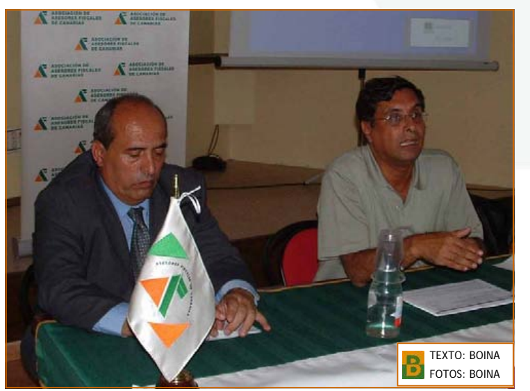
TEXTO: BOINA