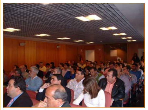
Instantánea del Salón de Actos

de estudios de la Asociación, y contaron con la inestimable colaboración de A3 Software y la Mutua de Accidentes de Canarias, quien además cedió desinteresadamente su salón de actos para la celebración de la Jornada de Estudios.