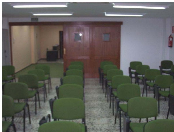
Salón de Actos