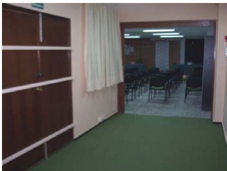
Acceso al Salón de Actos