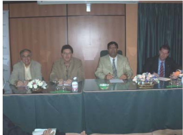
Imágenes de la mesa presidencial de la asamblea

Terminada la Asamblea General Ordinaria, tuvo lugar una Asamblea General Extraordinaria, con un único punto en el orden del día: Incorporación de la Asociación de Asesores Fiscales de Canarias a la Federación Española de Asociaciones Profesionales de Técnicos Tributarios y Asesores Fiscales (FEAPTTAF). La asamblea de asociados por unanimidad, decidió la incorporación.