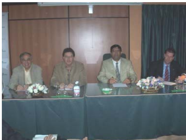
Imagen de la mesa presidencial de la asamblea

Terminada la Asamblea General Ordinaria, tuvo lugar una Asamblea General Extraordinaria, con un único punto en el orden del día: Incorporación de la Asociación de Asesores Fiscales de Canarias a la Federación Española de Asociaciones Profesionales de Técnicos Tributarios y Asesores Fiscales (FEAPTTAF). La asamblea de asociados por unanimidad, decidió la incorporación.