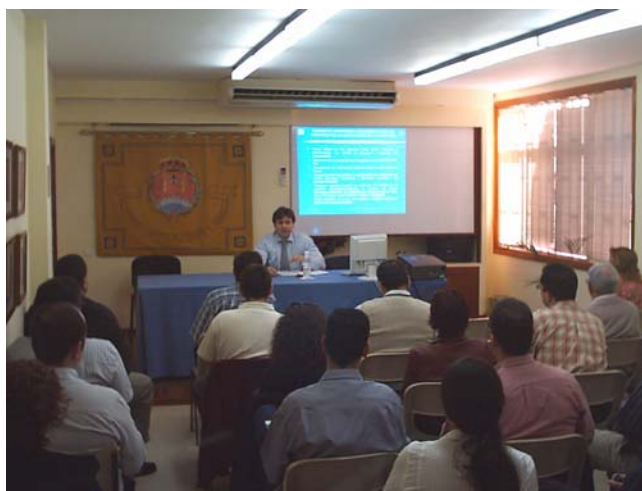
Imágenes de la jornada celebrada en Tenerife