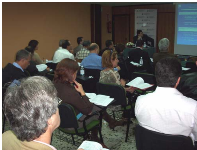
Imágenes de la jornada celebrada en Gran Canaria

E l pasado viernes 26 de marzo, la Comisión de Estudios de la Asociación de Asesores Fiscales de Canarias, organizó una jornada sobre la LEY GENERAL TRIBUTARIA, PROCEDIMIENTOS DE GESTION, simultáneamente en Gran Canaria y Tenerife. Estos eventos que contaron con la colaboración de Editorial CISS, han supuesto una novedad en la organización de jornadas y seminarios por parte de la Asociación, ya que al hacer una simultaneidad entre las dos islas y por el éxito en la organización, se comprueba que en un futuro las jornadas y seminarios, a través de videoconferencias u otro dispositivo, se podrán simultanear entre todas las islas.